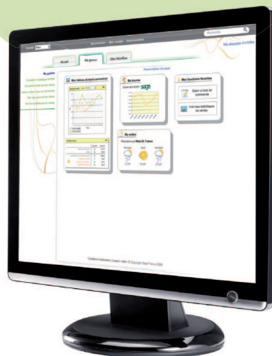
Accédez à votre espace de gestion personnalisé

Le recouvrement d'une créance se fait simplement à partir de la solution en consultant le dossier. Il est simple pour le chargé de recouvrement d'extraire un compte client et d'intervenir sur le recouvrement.